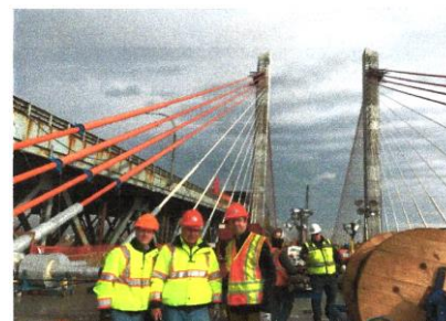
Most Kościuszki w Nowym Yorku w budowie 2017 r.

Fundacja Kościuszkowska organizuje w czasie tego roku wiele konferencji, wystaw edukacyjnych i publicznych spotkań.